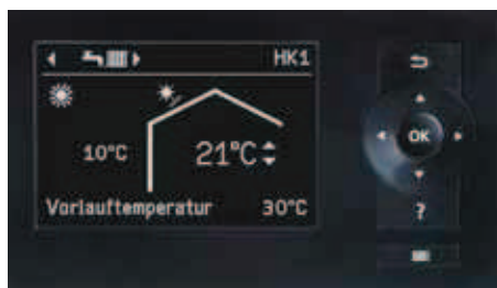
Vremensko vodena regulacija toplotne črpalke Vitotronic 200 (tip WO1C)