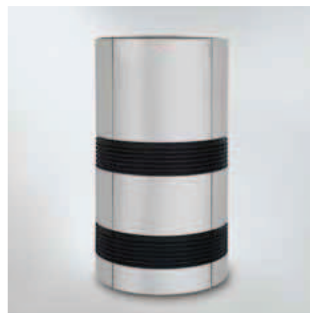
Vitocal 300-A za postavitve na prostem

Dotatne prihranke obratovalnih stroškov omogoča priključitev na fotonapetostno napravo. Električna energija iz lastne proizvodnje se lahko koristi za obratovanje kompresorja, regulacije, črpalk in ventilatorja v toplotni črpalki Vitocal 300-A. Dodatno je toplotna črpalka pripravljena za Smart Grid.